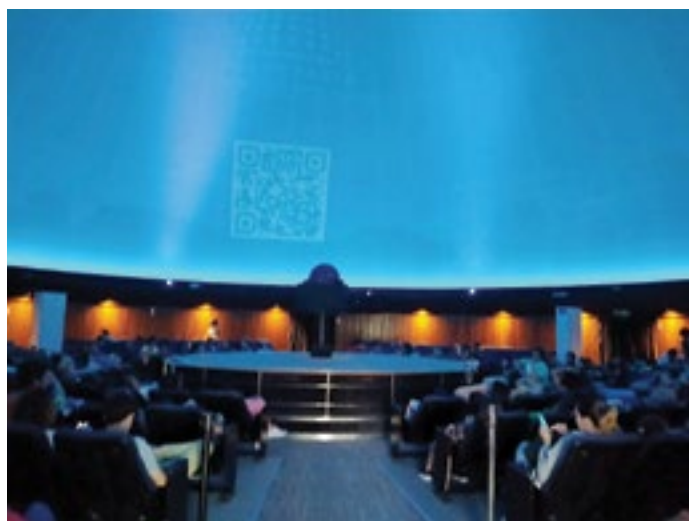
«Fulldome», el teatro de proyección esférica del Planetario de Buenos Aires “Galileo Galilei”

https://www.fddb.org/author/creativeplanet/