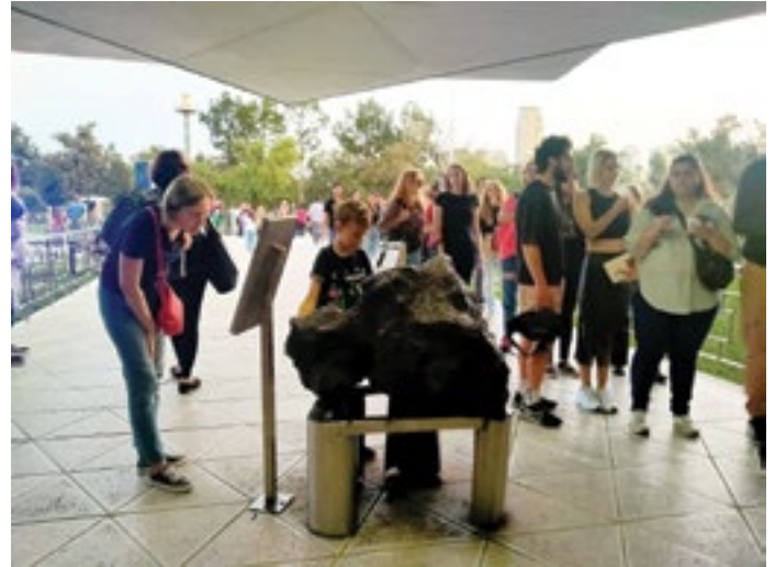
Apreciando meteoritos, en la explanada de acceso y vista al Planetario .

«Dream to Fly-Fulldome» fue una experiencia única disfrutando en familia, con tintes interesantes de marcada originalidad y singularidad, innovadora tecnología y de aprendizajes. Todo en un entorno planetario que combina espacios con “las escaleras helicoidales que conectan como un canal y por donde asciende el conocimiento” hasta llegar a la inmensa cúpula. Y ya finalizado el evento, en el marco del tiempo circular y la otoñal estación del año, el Planetario se ilumina con los distintos matices de colores.