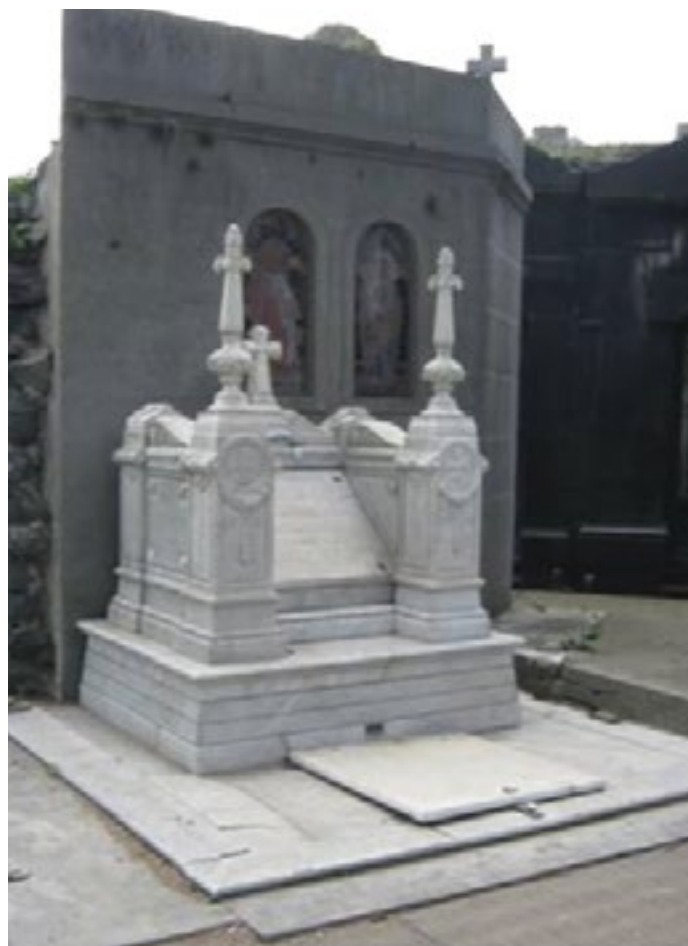
** Tumba de Mariquita Sánchez de Thompson, casi con seguridad aquí también descansan los restos de Isabela Walewska.

* El cadáver de la Párvula Isabel Elvira, tenía 6 días de edad, era hija del Ministro Extraordinario de la Francia, Don Alejandro Colonmo Conde Walewski y de Doña María Ana Condesa de Walewski de Ricci, está sepultada en este Cementerio del Norte.